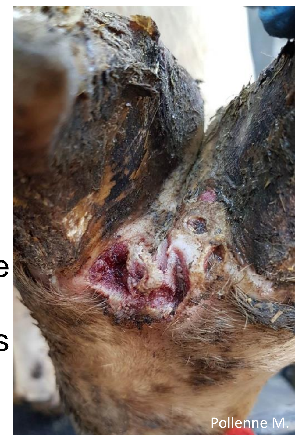
Lésion de dermatite digitale observée sur la face dorsale (= à l'avant) d'un antérieur